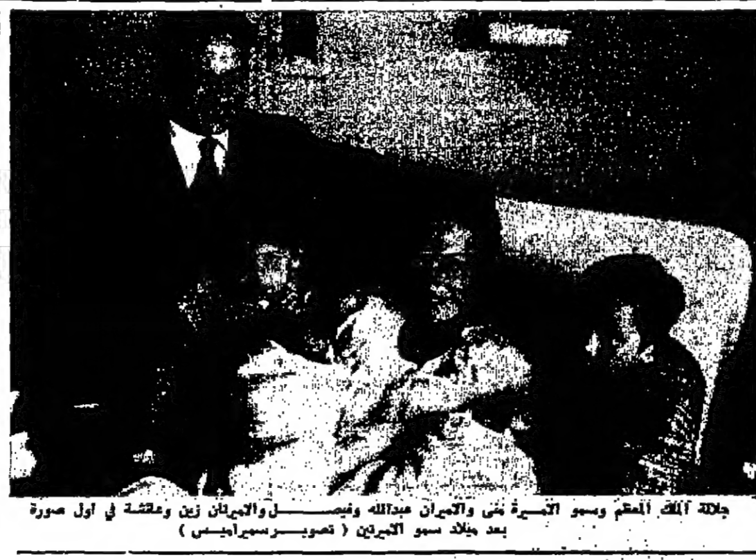
جلالة الملك المعظم وسوا الوزراء في اجتماعهم في أول صورة بعد جلالة سوا العجرات

ممتازة اضافية للأمن في إسرائيل أذاع راديو إسرائيل ان بنحاس سايير وزير مالية إسرائيل سيتمتدنيا الى الكتيبتشروع ميزانية اضافية بمبلغ ثلاثمائة مليون ليرة لتغطية احتياجات الأمن وسيطلب اقرار مبلغ خمسائة مليون ليرة لحاجات الأمن منها ٢٠٠ مليون ليرة توفر من ميزانية التنمية و ٢٠٠ مليون ليرة ستجمع عن طريق بيع سندات الدفاع للجمهور والبنوك الإسرائيلية .